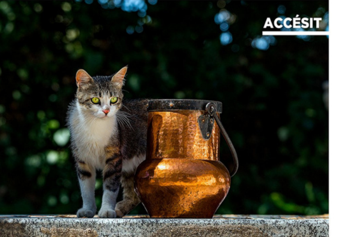
'MÁS VIDAS QUE UN GATO' AUTORA: SUSANA RUFO (MADRID)