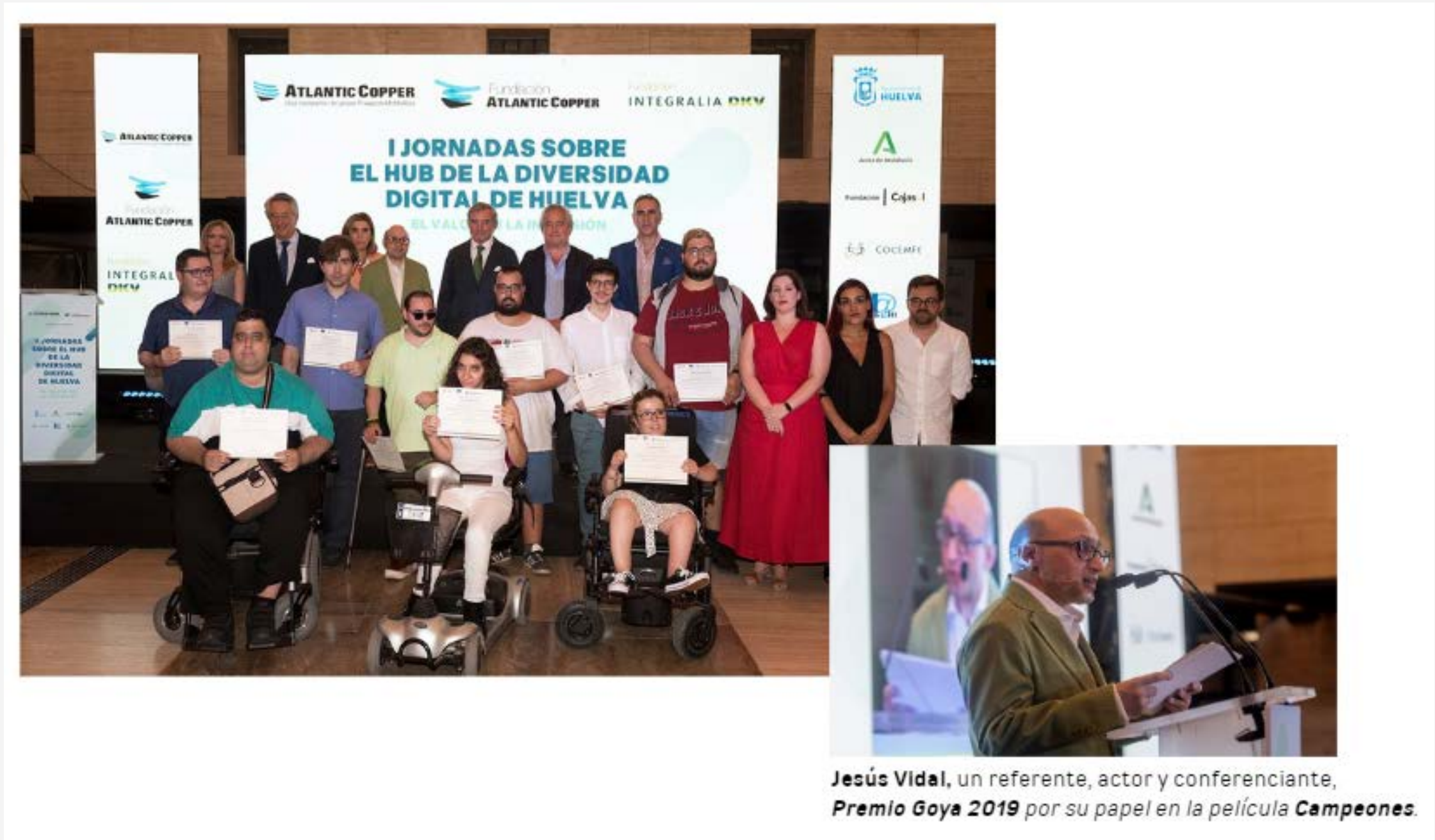
Jesús Vidal, un referente, actor y conferenciante, Premio Goya 2019 por su papel en la película Campeones .

Grado de cumplimiento: 104% (diciembre 2023)