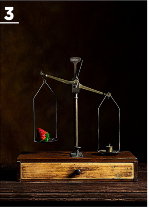
'LA BALANZA' AUTORA: TEODORA ROBLES (MÁLAGA)