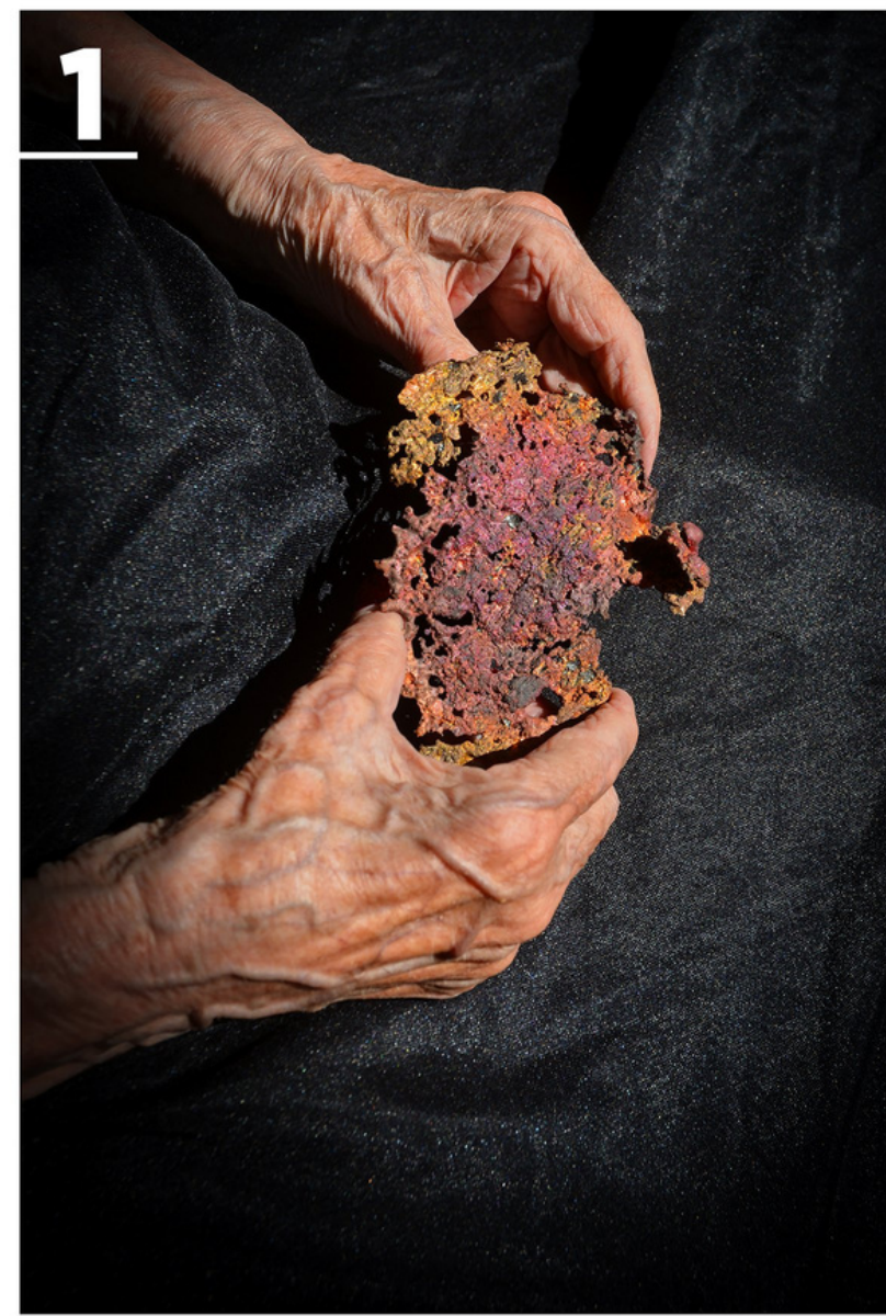
'EN BRUTO' AUTORA: MERCÉ PABLO (BARCELONA)