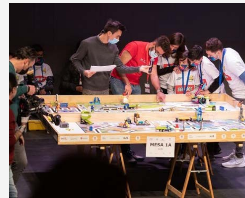
FIRST LEGO LEAGUE 2023

9+2 equipos / 3 chicas liderando sus equipos