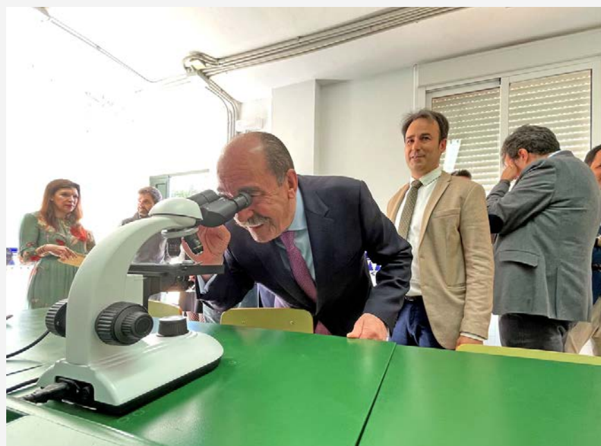
AULA DE CIENCIAS SAFA FUNCADIA