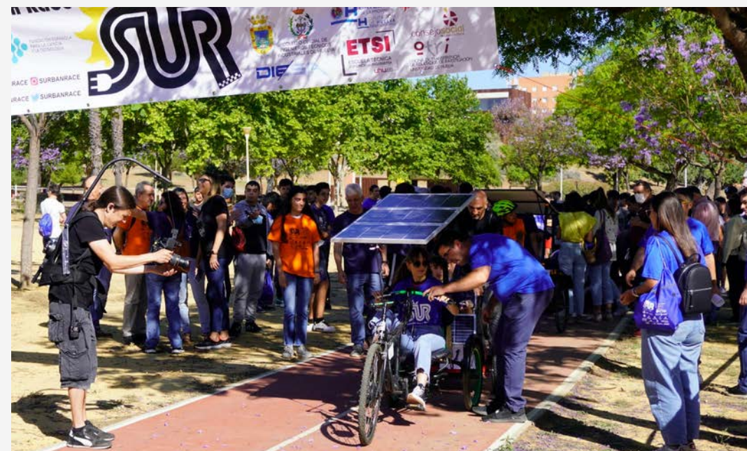
SUSTAINABLE URBAN RACE SUR_23

Secundaria, Ciclo Formativo y Bachillerato