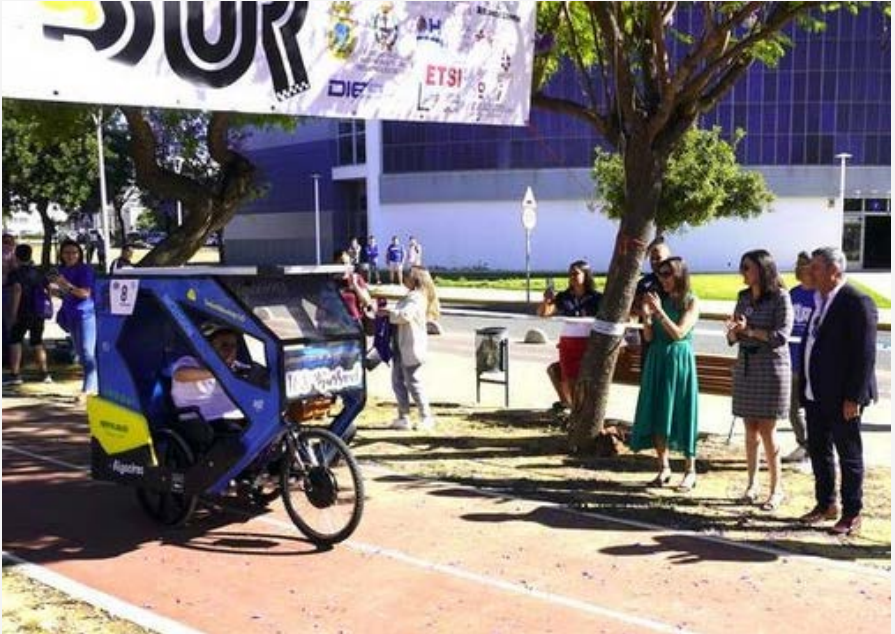
SUSTAINABLE URBAN RACE (SUR 22)

Fomento de carreras STEM entre los jóvenes onubenses, potenciando el colectivo femenino.