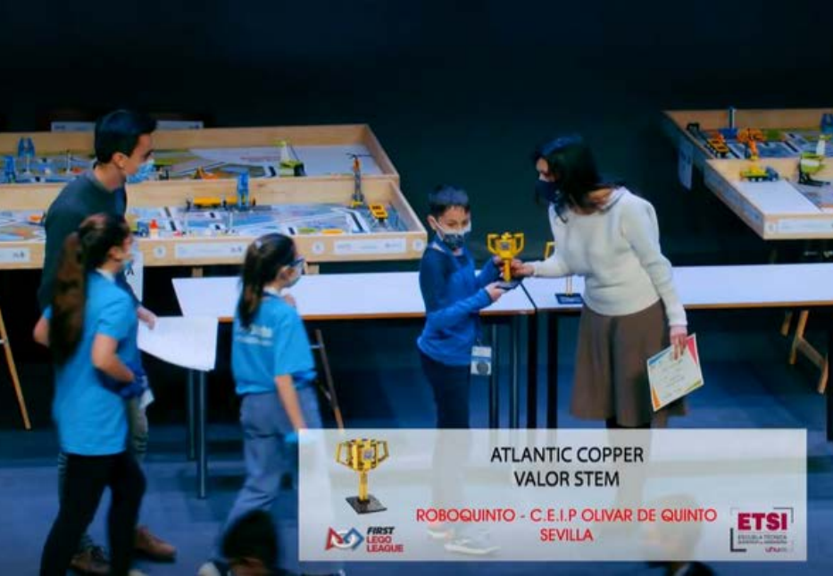
FIRST LEGO LEAGUE

La UHU participa por 1ª vez con dos equipos, en la prestigiosa competición internacional, uno de ellos es 100% femenino , para las categorías Petrol (Combustión) y 100% eléctrica.