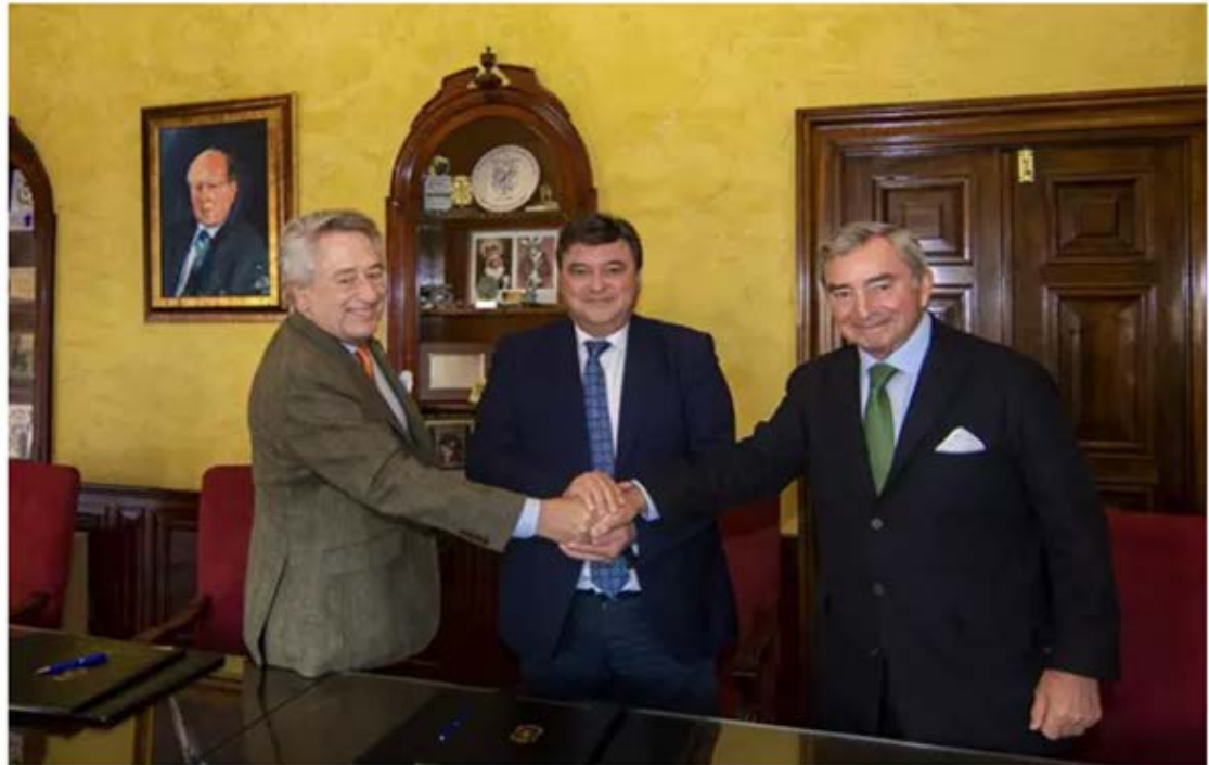
El Ayuntamiento se suma al Hub Diversidad Digital impulsado por la Fundación Atlantic Copper y DKV. - AYUNTAMIENTO DE HUELVA