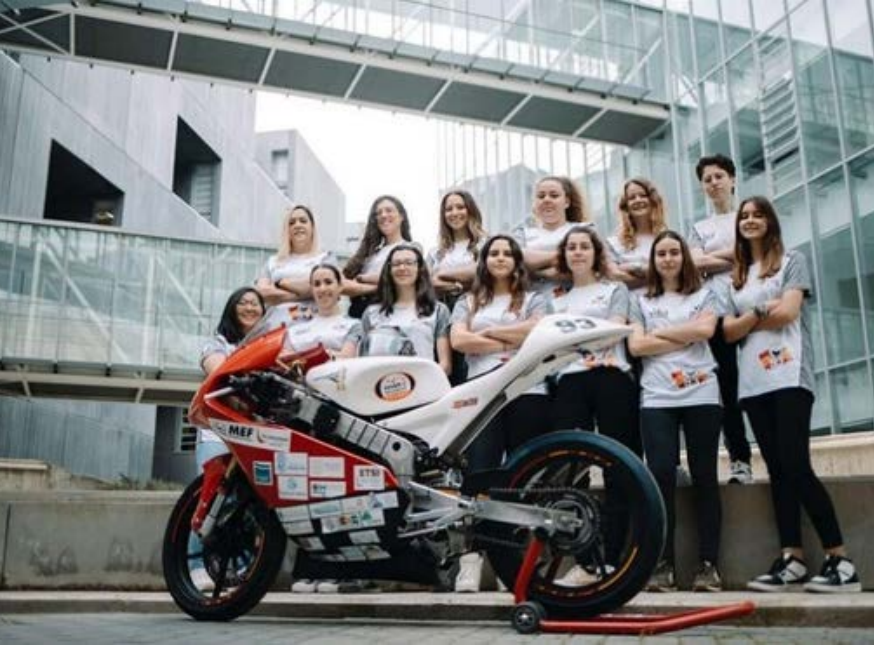
MOTO STUDENT ETSI

La UHU participa por 1ª vez con dos equipos, en la prestigiosa competición internacional, uno de ellos es 100% femenino , para las categorías Petrol (Combustión) y 100% eléctrica.